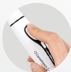
Facile acquisizione delle immagini con un solo clic