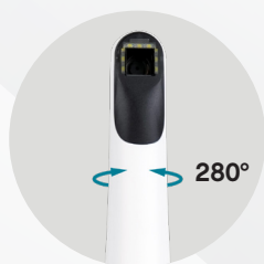
Testina rotante a 280°