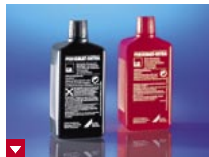
Die Dürr Periomat Intrachemie aus Entwickler und Fixierer ist genau auf die heutige Prozessleistung abgestimmt

Dürr Dental GmbH & Co. KG Höpfigheimer Straße 17 74321 Bietigheim-Bissingen