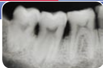
Drei Molaren vollständig in einer Aufnahme

Entwicklung intraoraler Filme mit Periomat Plus