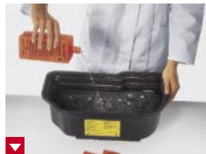
Gründliche Reinigung des Transportsystems mit dem Dürr Perioclean-Set