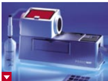
Dürr Periomat Plus mit Meßflasche