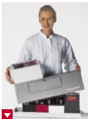
Der Dürr Periomat Plus unterstützt die Arbeit in der Praxis ganz einfach und unkompliziert

Für einen Röntgenfilm-Entwicklungsautomaten ist der Dürr Periomat Plus unglaublich handlich. Er braucht nur einen Stromanschluß, Wasser und Chemie, schon kann die Entwicklung losgehen. Ihr Depot stellt den neuen Periomat Plus betriebsfertig auf und erledigt die vorgeschriebene Abnahme- oder Teilabnahmeprüfung nach der Röntgenverordnung RÖV. Mehr ist nicht nötig, um anschließend perfekte Röntgenbilder zu entwickeln und zu archivieren.