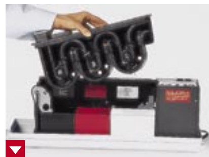
Mit nur einem Handgriff ist das Transportsystem herauszunehmen

Zweimal jährlich sollte das Transportsystem gründlich gereinigt werden. Das Dürr Perioclean-Set mit Universal-Tankreiniger, Wanne und Bürste bietet dafür die ideale Lösung. Mit dem Periomat Plus ist es eben wirklich wie mit einem guten Freund: je besser man ihn behandelt, desto länger hat man Freude mit ihm. Und jahrelang perfekt entwickelte Filme.