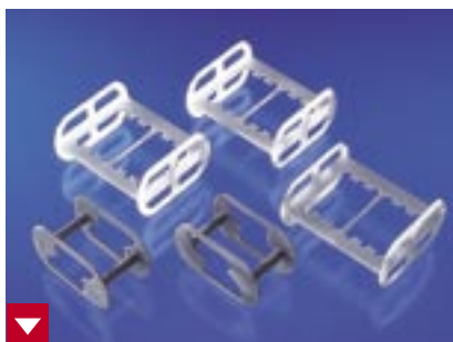
Durch die Adapter ist die Entwicklung aller intraoralen Filmformate möglich