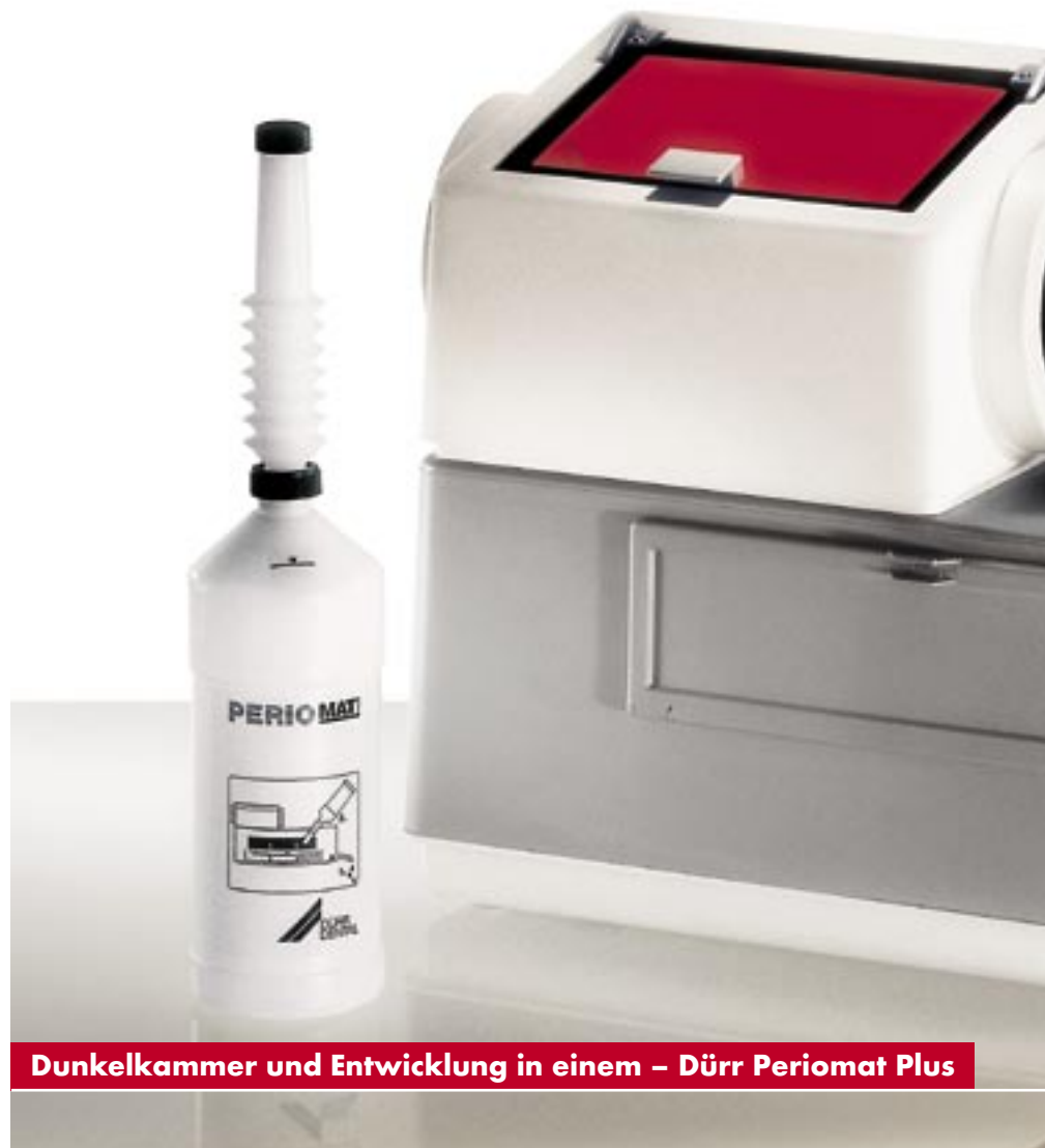
Dunkelkammer und Entwicklung in einem – Dürr Periomat Plus

Weltweit wurden mit dem Periomat seit Jahren Milliarden intraoraler Filme perfekt entwickelt. Ohne Schlieren, ohne Streifen, präzise mit hoher Dichte. Auf den Periomat ist nach wie vor Verlass. Denn all diese Filme liegen gesichert in den Praxen vor, weil ihre Archivierfähigkeit mehr als zehn Jahre gewährleistet ist. Dafür gibt es gute Gründe: Die temperaturgeregelte Heizung für das Entwickler- und Fixiererbad arbeitet mit der in der RÖV geforderten Genauigkeit von \pm 0,5^\circ\text{C} . Und die Konstanzprüfung ist problemlose Routine.