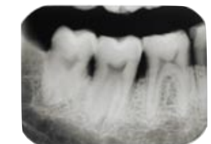
In nur fünf Minuten entwickelt der Dürr Periomat Plus bis zu acht intraorale Filme