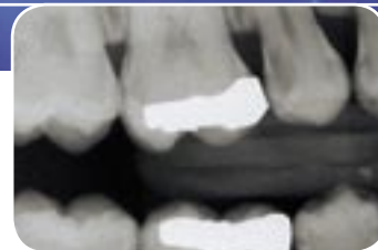
Bissflügelaufnahme in Rechtwinkeltechnik