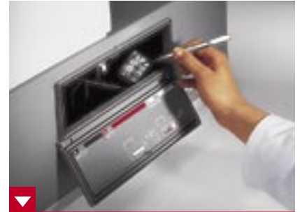
Entwickler - Fixierer - Wasserbad - in der Dunkelkammer blitzschnell zum sauberen Entwicklungsergebnis von Endofilmen

So sichert eine ganze Reihe nützlicher Extras dem Periomat Plus auch für die Zukunft eine bedeutende Rolle in der Praxis.